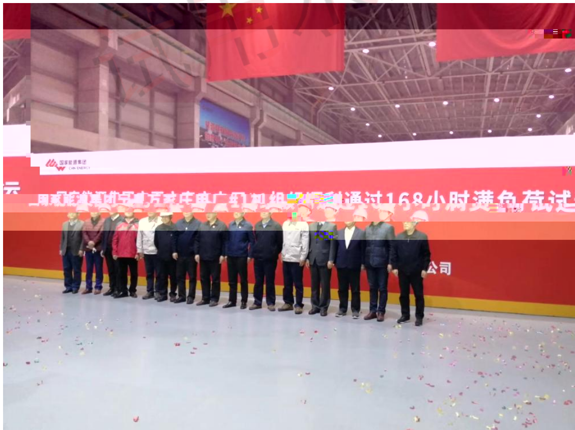
公司参与 国 团宁夏 厂 2×1000MW